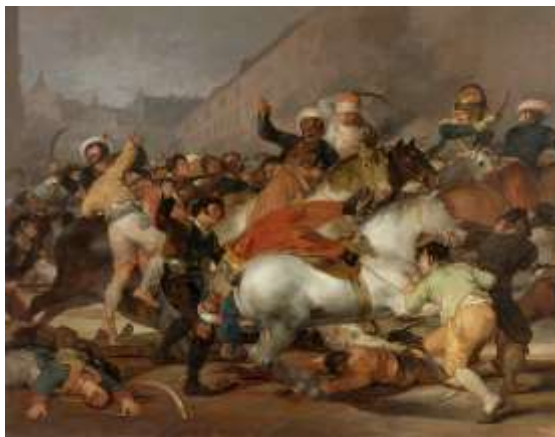
Dos de Mayo, Francisco de Goya, 1814, Musée du Prado, Madrid (Espagne). Inv P00748.