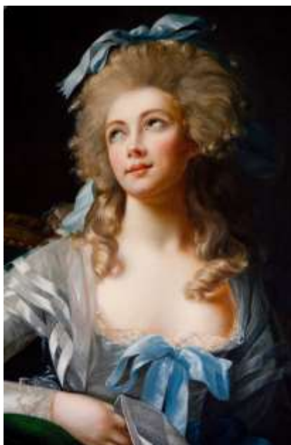
Madame Grand, Élisabeth Louise Vigée Le Brun, 1783, The MET, New-York (USA). Inv 50.135.2

Dès lors, Catherine va connaître une vie plus discrète partagée entre Londres, Saint-Pons, Bruxelles puis Paris qu'elle retrouve probablement dès 1817. Elle va tenir un salon dans son immeuble de la rue de Lille à Paris durant les quinze dernières années de sa vie et va tomber quelque peu dans l'oubli. Elle s'éteint le 9 décembre 1835, à l'âge de 74 ans, à la fin d'une vie extraordinaire et riche en aventures.