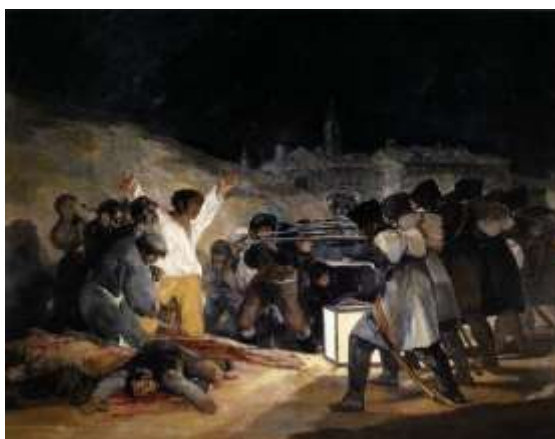
Tres de Mayo, Francisco de Goya, 1814, Musée du Prado, Madrid (Espagne). Inv P00749

En 1814, une coalition d'États envahit la France et exile Napoléon sur l'île d'Elbe, puis sur l'île de Sainte-Hélène après l'épisode des Cent Jours. La défaite de Waterloo en 1815 met définitivement fin à l'Empire. La victoire sur Napoléon est alors celle des monarques européens coalisés et des peuples dont le sentiment national s'est affirmé.