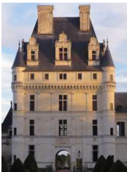
Façade nord du Donjon, Château de Valençay

Par la suite, les petits-enfants de Dominique d'Estampes n'arrivant pas à trouver d'accords entre eux, le château sera vendu. C'est alors la fin de la famille d'Estampes à Valençay.