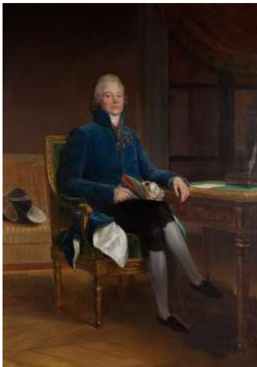
Charles-Maurice de Talleyrand-Périgord, Prince de Bénévent, baron François Gérard, 1808, MET, New York (USA). Inv 2012.348.

Talleyrand est favorable à une monarchie constitutionnelle, c'est-à-dire à un système politique alliant le pouvoir de la royauté et celui des citoyens représentés à travers le vote. Grand lecteur, il partage également les principes défendus par les philosophes des Lumières autour de la liberté et de l'égalité entre les Hommes. Vous retrouverez, d'ailleurs dans son cabinet de travail deux bustes, qui sont ceux de Voltaire et Rousseau.