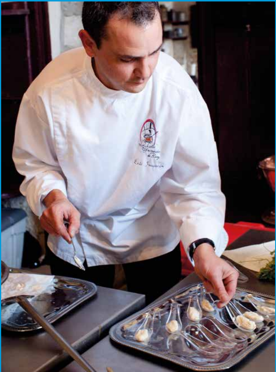
© Château de Valençay – Michel Chassat