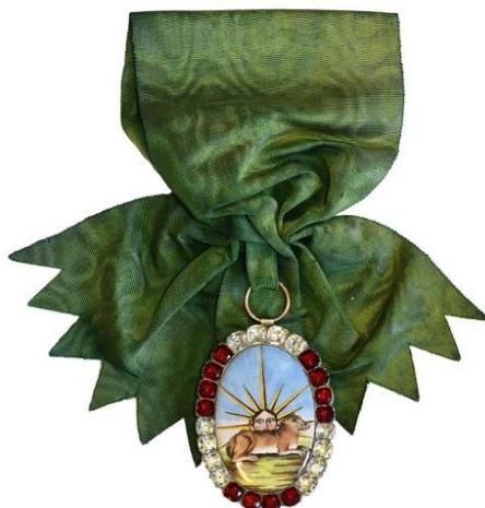
Médaille de l'ordre du Lion et du Soleil de Perse décernée à Talleyrand (collection du château de Valençay)

décernées au fil de sa carrière de diplomate, elles sont autant de jalons attestant son influence sur la scène internationale sous l'Empire puis, après l'apogée que constitua le Congrès de Vienne (1815), sous la Restauration. Outre les principales décorations françaises (Légion d'honneur, ordre du Saint-Esprit), cet exceptionnel ensemble comprend des insignes de la plupart des ordres européens ainsi que quelques pièces uniques, tels la plaque et l'insigne de l'ordre du Lion et du Soleil de Perse 2 , et ne connaît guère d'équivalents dans les collections publiques françaises.