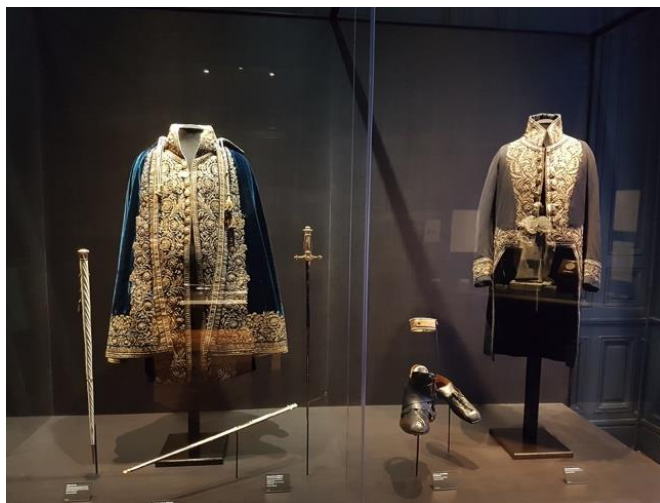
La salle des trésors du château de Valençay.

Demeuré la propriété des successeurs de Talleyrand jusqu'en 1979, le château de Valençay se caractérise par ses remarquables collections de mobilier évoquant tout autant le cadre de vie du diplomate que celui de ses héritiers. Si l'on sait que ce mobilier a connu quelques modifications au gré de son usage, mais aussi de l'évolution des goûts et des normes de confort 1 , il est un ensemble d'objets qui a connu, et ce depuis presque deux siècles, une certaine stabilité : celui des effets personnels du prince de Talleyrand, aujourd'hui présentés dans la salle des Trésors.