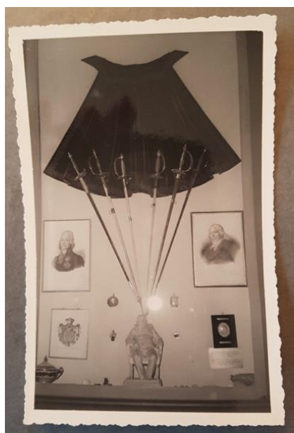
Une vitrine dans le musée de l'orangerie en 1958.

On la retrouve en 1953 dans l'orangerie du château, lorsque le R. P. Raoul décrit dans son Guide historique de Valençay le musée qui s'y trouve installé 26 . L'orangerie avait été affectée durant la seconde guerre mondiale au personnel dédié à la garde des nombreuses œuvres d'art appartenant aux musées nationaux qui furent abritées au château entre 1939 et 1946 27 . La collection ne put donc y être transférée que dans l'après-guerre. Ce musée abritait une reconstitution de la chambre de Talleyrand — sans doute aux fins de pallier l'absence du mobilier de la chambre valencéenne du prince, vendu dans l'intervalle —, de nombreux meubles, tableaux et gravures, ainsi que les costumes, épées, décorations et sceaux du prince, sa canne et ses chaussures orthopédiques. Le bureau qui lui aurait été offert par le prince Murat (aujourd'hui dans le cabinet Périgord) s'y trouvait également. Une photographie de ce « musée des souvenirs du prince de Talleyrand », datée de 1958 28 , montre l'une des vitrines constituées. On y reconnaît notamment le médaillon contenant la mèche de cheveux du prince et la bonbonnière offerte à la marquise de Jaucourt, tous deux conservés aujourd'hui dans la salle des Trésors.