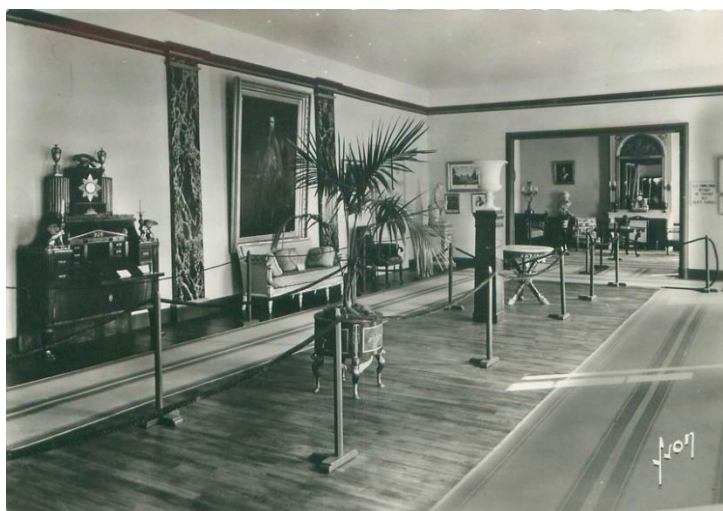
Le musée de l'orangerie (carte postale « Yvon » - cliché anonyme 30 ).

culture, des arts et des loisirs 29 . Outre le guide du R. P. Raoul, quelques cartes postales vraisemblablement datées des années 1970, ainsi que l'acte de vente du domaine, qui comprend en annexe un descriptif détaillé du mobilier, fournissent de précieux renseignements sur l'agencement et le contenu de ce musée, qui ne semblent guère avoir varié entre 1953 et 1979.