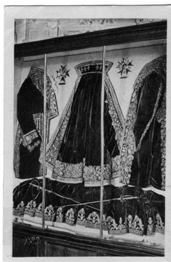
Une vitrine dans l'antichambre de la chambre du roi, sans date (carte postale « Yvon », collection André Beau – cliché anonyme).

Entre 1979 et 1986, la collection fut transférée dans le corps principal du château, dans des vitrines aménagées dans les antichambres respectives de la chambre du roi et du salon de musique 31 .