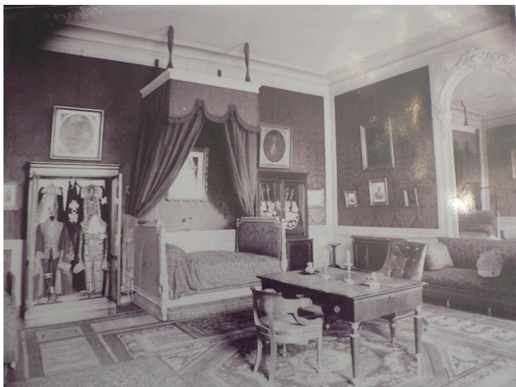
Photographie de la chambre de Talleyrand, vers 1898 (collection André Beau – cliché anonyme).

présence, dans la « chambre du prince de Talleyrand », de « 2 armoires en ébène renfermant les effets et décorations du prince de Talleyrand ». En 1885, écrivant au duc de Valençay au sujet de travaux effectués dans un cabinet de toilette attenant, le sieur Chevrier, secrétaire-caissier du domaine, écrit à propos de cette chambre : « Je sais, Monsieur le Duc, que vous conservez très fidèlement la mémoire des lieux 13 ». Plusieurs photographies et une aquarelle de la fin du XIX e siècle montrent de fait un aménagement similaire à celui de 1867, à quelques détails près : le portefeuille au soleil et le portefeuille dit « Constantinople 1806 » (sur le bureau) et la paire de chaussures orthopédiques de Talleyrand (près du canapé) n'apparaissent que sur l'aquarelle 14 .