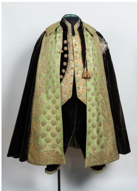
Le costume de l'ordre du Saint-Esprit après restauration (collection du château de Valençay – cliché François Lauginie pour la DRAC Centre Val-de-Loire).

pas exactement la même, ceci afin de produire un effet harmonieux pour l'œil sans pour autant créer l'illusion d'un objet parvenu intact jusqu'à nous 34 . Enfin, si l'intervention des restaurateurs permet de stopper les processus de dégradation à l'œuvre et de redonner aux objets, autant qu'il est possible, une apparence proche de leur aspect originel, elle ne peut à elle seule garantir leur bonne préservation sur le long terme. Ce sont ensuite les conditions de conservation matérielle (choix de vitrines et de modes de soclage adaptés, contrôle des conditions environnementales et de la luminosité, prévention des sinistres) qui prennent le relais afin d'éviter autant que faire se peut l'apparition de nouvelles altérations et de préserver ce patrimoine au profit des générations futures, tout en en garantissant l'accès aux générations présentes.