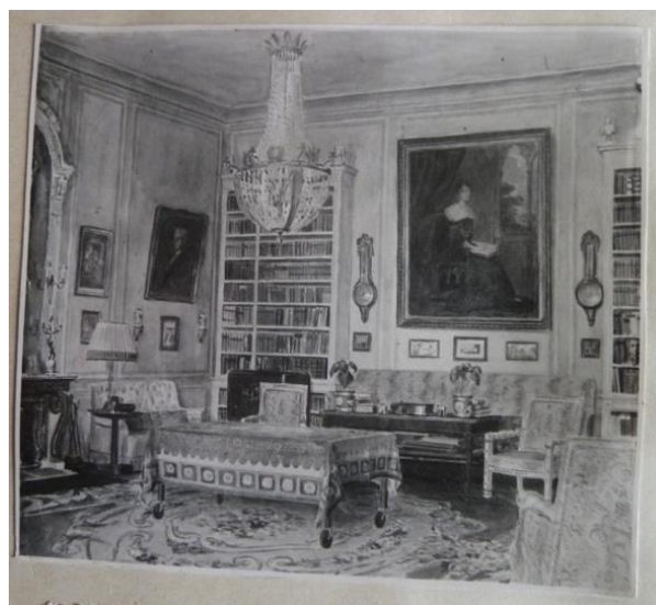
Le bureau-bibliothèque, ancienne salle de billard, en 1942 (Arch. dép. Indre, 109 J 47 – aquarelle de Mogens Tvede).

La pièce fit ensuite office de bureau-bibliothèque, comme l'atteste une aquarelle réalisée en 1942 par Mogens Tvede, conservée dans l'un des albums photographiques de la famille 24 . Les deux armoires d'ébène n'apparaissent plus sur les quelques documents iconographiques représentant l'ancienne chambre de Talleyrand après 1901.