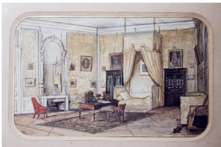
Aquarelle représentant la chambre de Talleyrand, sans date [fin du XIX e siècle ?] (collection André Beau).