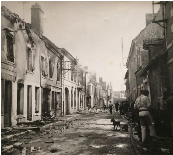
Valençay, août 1944, source : Fonds privé.

depuis juin 1940, quatre otages sont fusillés. Le château de Valençay n'est pas épargné, un gardien est tué, la ville est incendiée et le château et les collections qui y étaient conservées manquent de brûler 27 .