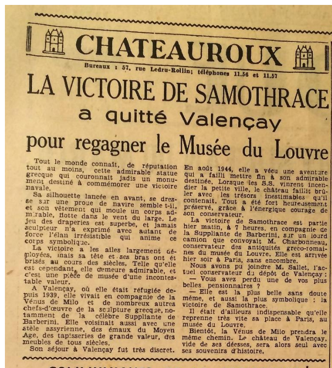
« La Victoire de Samothrace a quitté Valençay », La Nouvelle République (Tours), n° 242, 17 juin 1945.

propriétaires respectifs 33 . La presse s'est fait l'écho de ce retour victorieux, nous pouvons lire « La Victoire de Samothrace a quitté Valençay » (fig. 5) dans La Nouvelle République 34 ; « De Valençay au Louvre », dans La Marseillaise 35 ; « Valençay, Les chefs-d'œuvres (sic.) partent » dans La Nouvelle République du Centre-Ouest 36 , « L'Heureux retour, tendons les bras à la Vénus de Milo » dans Noir et Blanc 37 , et même « L'aventure de la plus belle femme du monde » dans le Journal Illustré Suisse 38 .