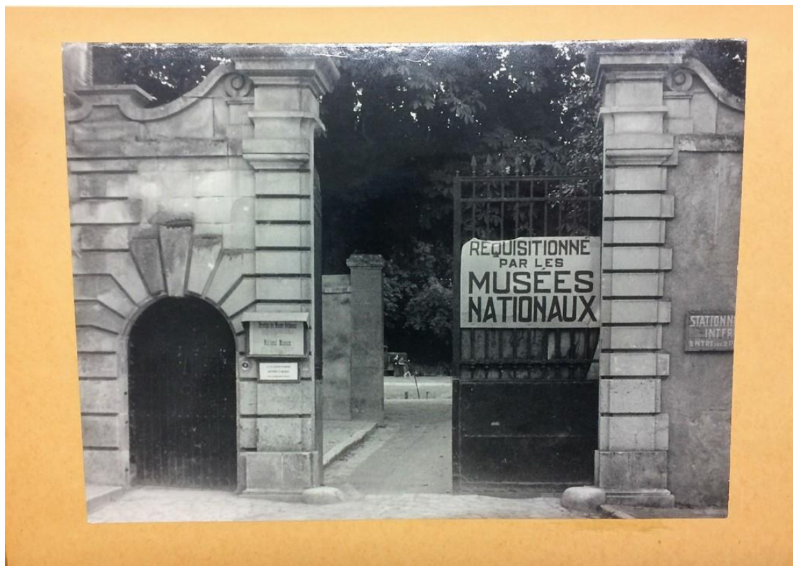
Entrée du dépôt de Valençay, rue de Blois

à la protection des dépôts en plaçant les sites concernés de la zone occupée sous protection militaire. Ce n'est pas le cas au dépôt de Valençay, qui se trouve en zone libre. Pourtant, des consignes de sécurité strictes règnent dans les dépôts et les gardiens sont invités à faire preuve de vigilance. Ils ont évidemment l'interdiction de renseigner quiconque sur la nature et la valeur des objets conservés 25 . Et, à Valençay comme dans la plupart des dépôts, une mesure de signalétique est mise en place avec des affiches officielles qui signalent l'entrée du dépôt et dissuadent d'y pénétrer sans autorisation.