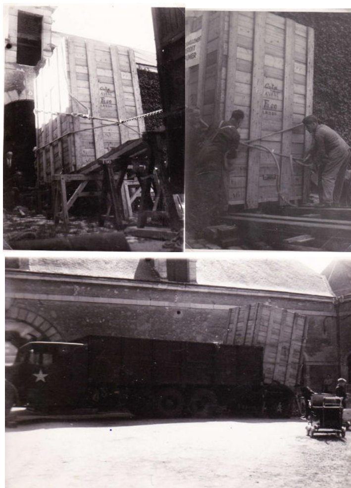
Le retour de la Victoire de Samothrace, juin 1945, Valençay