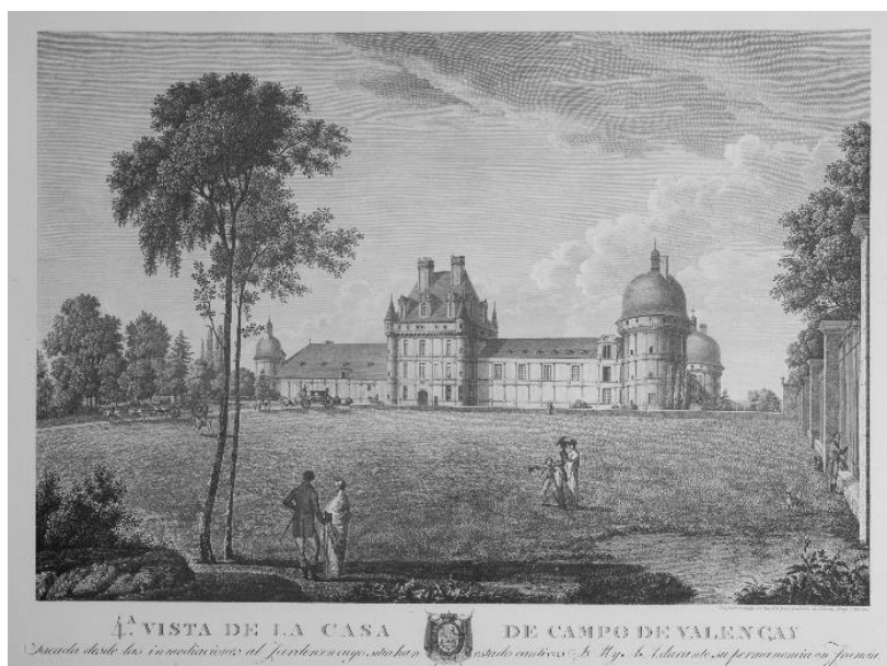
Ill. 5. 1.ª vista de la casa de campo de Valençay , par Felipe Cardano, 1 er quart du XIX e siècle – Gravure sur papier (collection Château de Valençay). Un cirque fut installé sur cette pelouse (aujourd'hui le jardin français) lors de la fête de l'empereur, le 15 août 1810.

Valençay, invité par le conseiller de préfecture à faire surveiller ledit Lonati, ce dernier arriva à Valençay le 31 juin [sic] pour en repartir dès le 1 er juillet 203 . On peut supposer que c'est ce même Cirque Franconi qui intervint lors de la fête de l'empereur 204 . Comme lors de la précédente cérémonie, un feu d'artifice, des illuminations — une étoile de la Légion d'honneur avait été placée sur le point culminant du château — et un concert dans les appartements des princes, au cours duquel fut peut-être exécuté le Chœur de guerriers de J.-B. Métoyen 205 , terminent la fête.