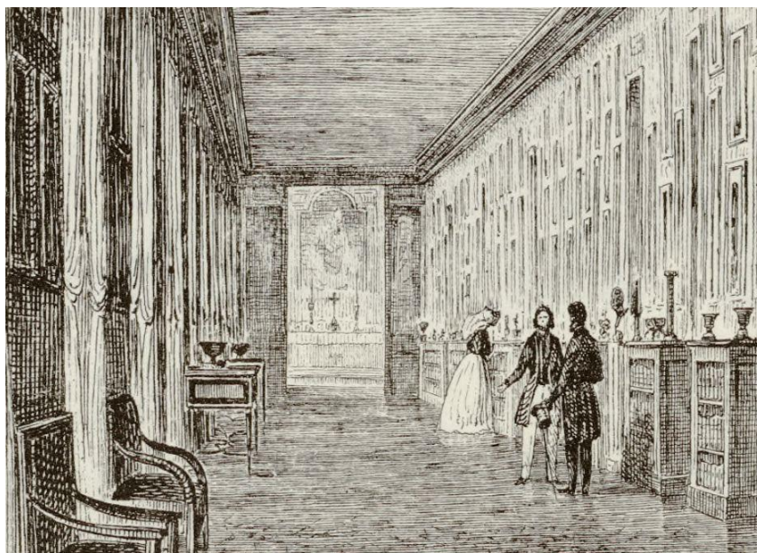
Ill. 4. Vue de la « galerie de gravures » (détail), avec la chapelle située au fond, gravure réalisée d'après les dessins d'Isidore Meyer, publiée dans M. de La Villegille, « Valençay », Esquisses pittoresques sur le département de l'Indre , Châteauroux, J.-B. Migné, 1854, p. [270].

aménager une galerie afin d'exposer les gravures et tableaux de M. Rolland, marchand d'estampes, arrivé à Valençay le 19 octobre 1812 186 .